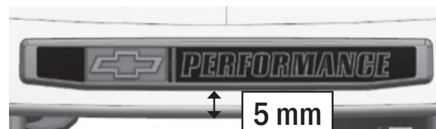
FIGURE 2 / FIGURA 2

Il est recommandé de nettoyer la surface de l'emblème avec un linge doux.